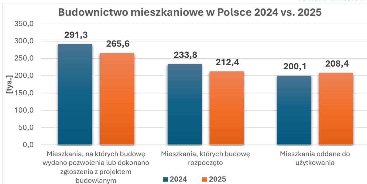
Rysunek 1. Budownictwo mieszkaniowe w Polsce 2024 vs. 2025.